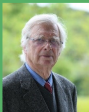
Sincères salutations, Pr Bernard Bioulac

Tels sont quelques éléments abordés dans la Revue de Bioéthique de la Nouvelle Aquitaine consacrée à la neuroéthique (Numéro 5).