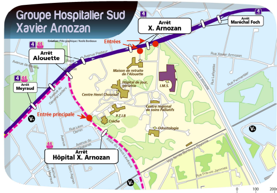
Lignes de Tram et de Bus les plus proches

Le Centre de Formation est situé au fond du parc de l'hôpital Xavier Arnozan. Suivre direction Institut des Métiers de la Santé.